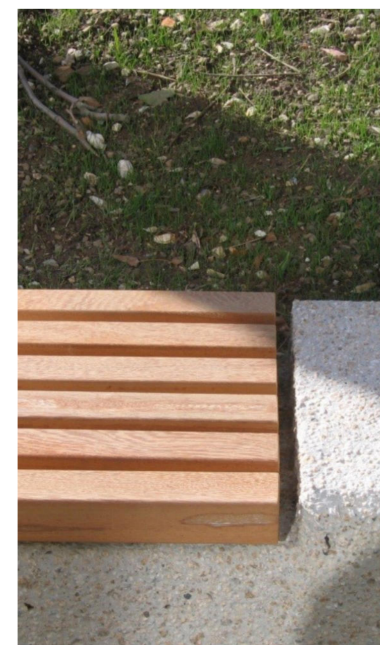
10 Sitzmauern mit Sitzauflage aus Holz