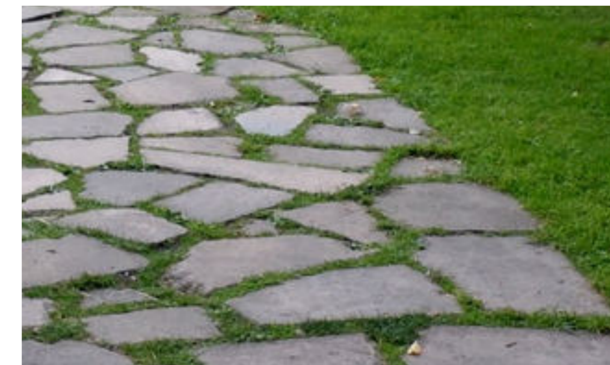
7 Polygonalfugenplatten Naturstein