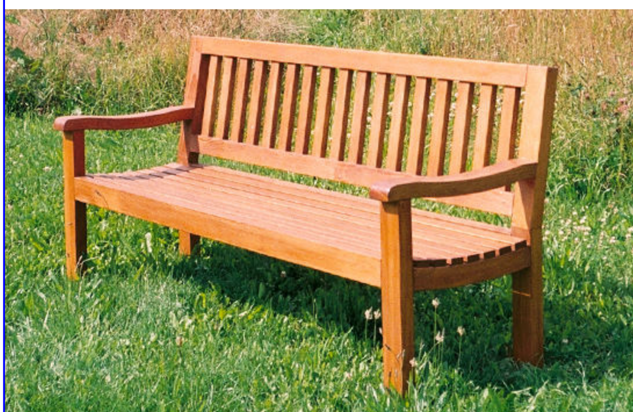
5 Sitzbank aus Holz