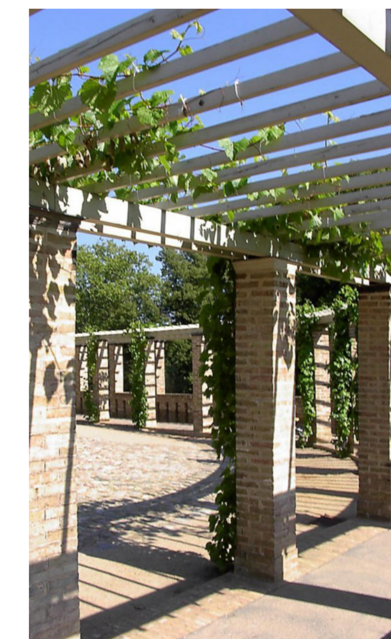
12 Pergola Natursteinsäulen mit Holzrahmen