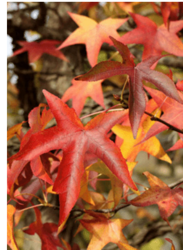
2 Liquidambar styraciflua 'Worplesdon' / Amberbaum 'Worplesdon' (Habitus / Blatt Herbstfärbung)