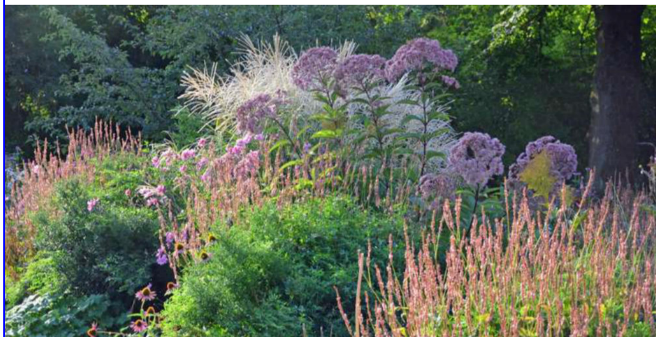
3 Referenzbild intensive Bodendecker-, Stauden-, Gräserpflanzung