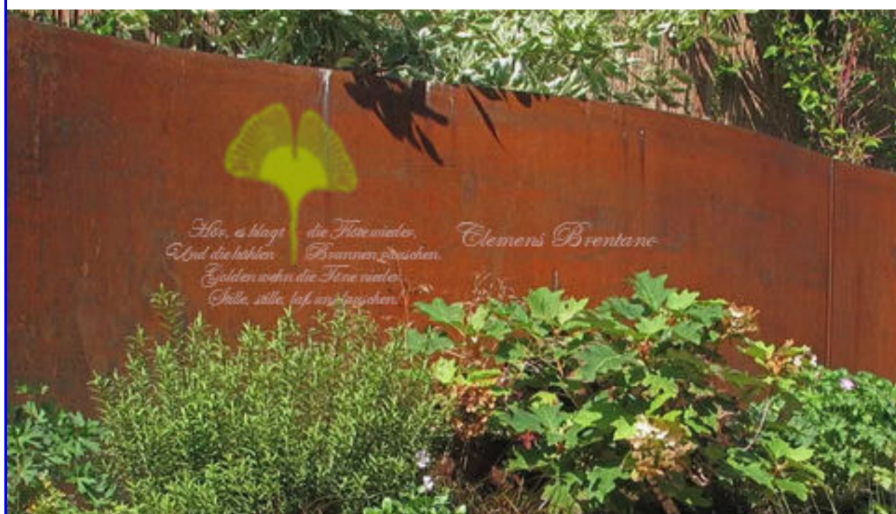
4 Paravent / Sichtschutz mit Kunst (ggf. Infotafeln)