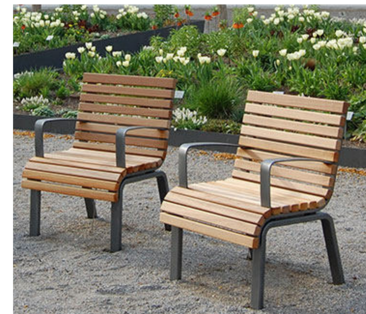
8 Mobile Sitzgelegenheiten