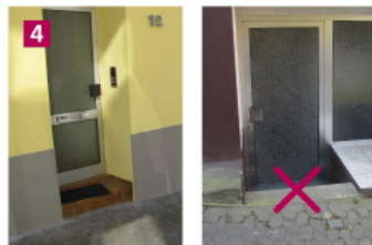
Eingänge in Handschuhheim – mit und ohne Schwelle