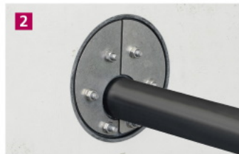
Individuelle Ringabdichtung IRD © Hauff-Technik, Gröbß & Co. KG