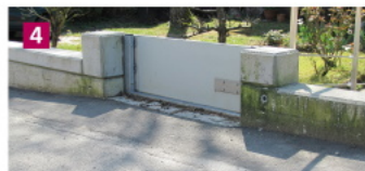
Schutz eines Grundstücks in Schörlach