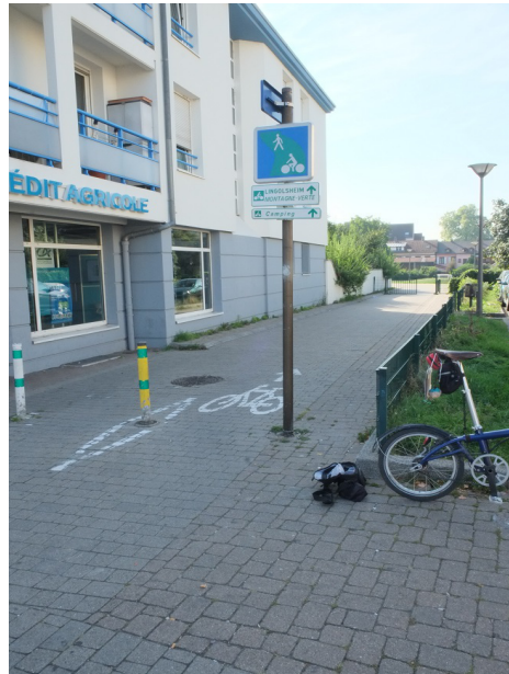
... weitere Varianten