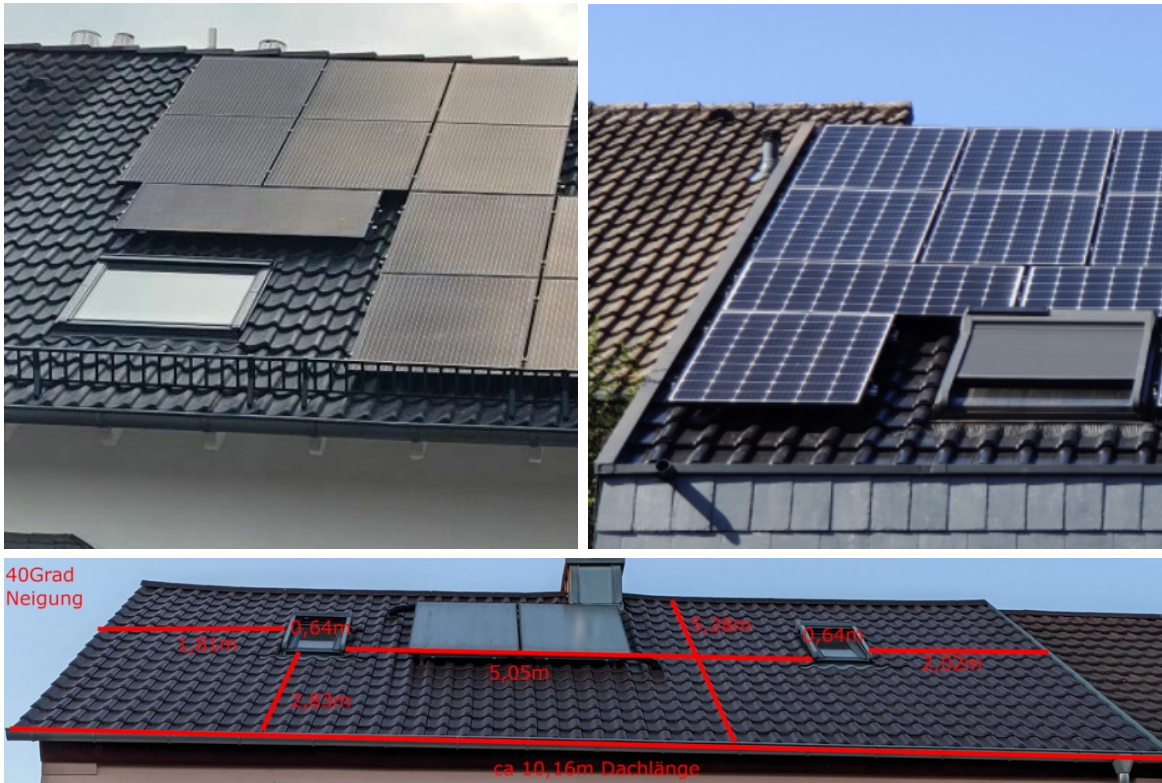
Oben links: Hoch- und Quermontage kann kombiniert werden. Oben rechts: Eine Belegung bis kurz an den Dachrand, First oder Traufe ist fast immer möglich. Unten: Ideale Vorarbeit für den Solarteur: Eine genaue Dachbemaßung.

Bei der Belegung kann und sollte zudem die Hochkant- und Quermontage kombiniert werden, wenn sich dadurch mehr Module auf dem Dach platzieren lassen (vgl. Foto links). Dies erhöht den Montageaufwand nur geringfügig und lohnt sich damit im Hinblick auf die größere Anlagenleistung. Ebenfalls kann die PV-Anlage, sofern die Unterkonstruktion ausreichend tragfähig ist, bis kurz an den Dachrand (ortgangs-, first- sowie traufseitig) gebaut werden (siehe Foto rechts) 3 . Ein Freilassen einer kompletten Ziegelreihe ist nur bei seltenen statischen Problemen erforderlich.