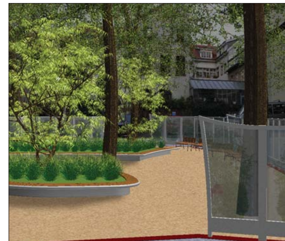
Blick auf Garten vom Theater aus