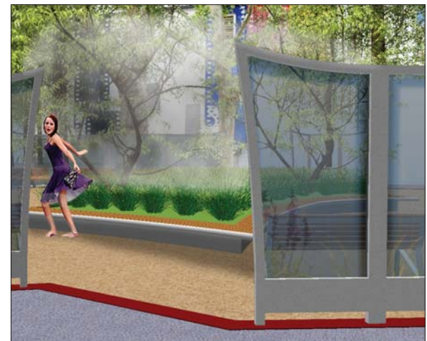
Blick in Garten mit laufender Nebelbrunnenanlage (z.B. stündlich)