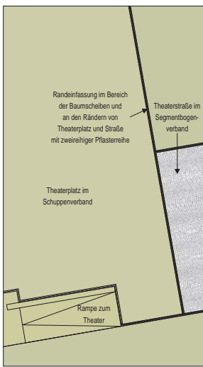
Verlegedetail Pflaster M 1:100