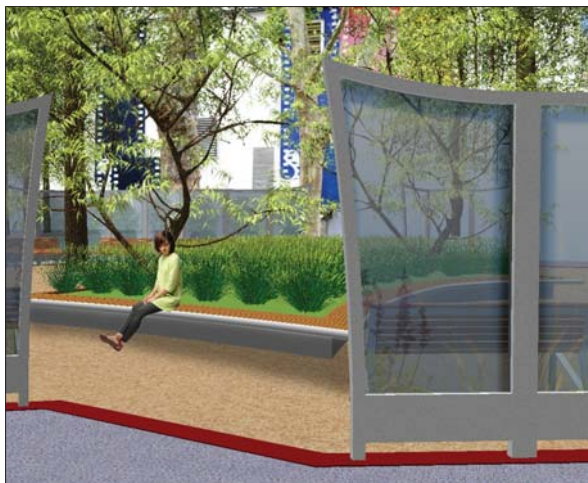
Blick in Garten in Richtung Nord-Westen ohne Nebel