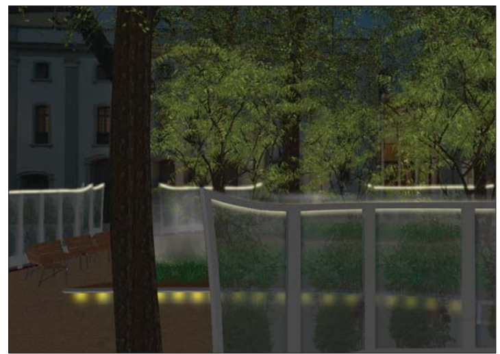
Nächtlicher Blick in Garten in Richtung Theatergebäude