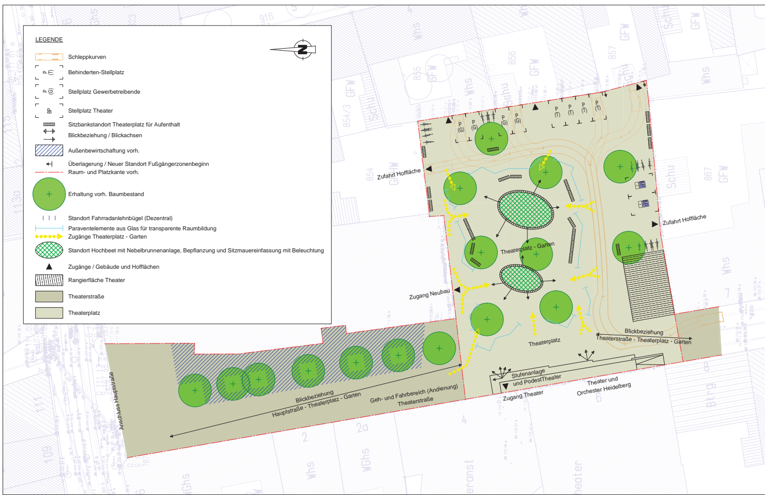
Funktions- und Nutzungsplan - M 1:200