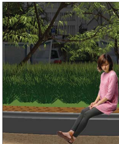
Blick in Richtung Süden