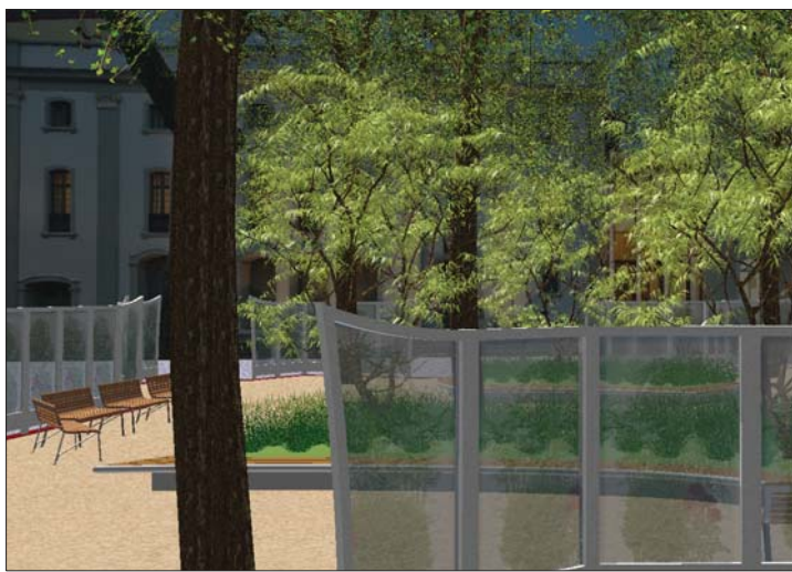
Blick in Garten in Richtung Theatergebäude