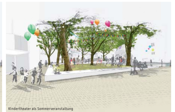
Kindertheater als Sommerveranstaltung