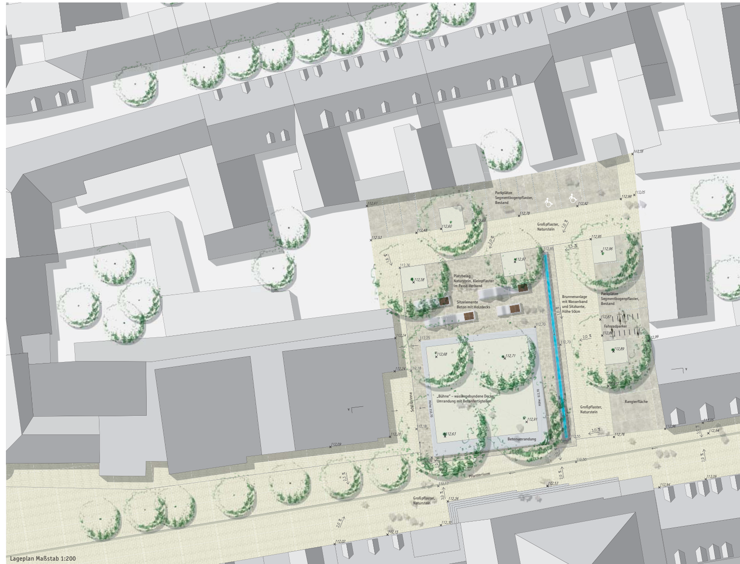
Lageplan Maßstab 1:200

Der Theaterplatz liegt inmitten der Altstadt von Heidelberg. Das Gelände wurde im Laufe der Stadtgeschichte vielfach überformt. Im Boden werden noch Spuren der mittelalterlichen Stadt vermutet, die als Bodendenkmal geschützt sind. Zuletzt als Parkplatz genutzt, soll der Platz nun in das Freiraumsystem der Innenstadt integriert werden. Der Platz erfüllt über seine Funktion als Freiraum hinaus auch Erschließungsfunktionen für die angrenzende Bebauung der Sandgasse. Die derzeit am östlichen und südlichen Rand befindlichen PKW-Stellplätze und Rangierflächen für die Anlieferung des Theaters sind dort am wenigsten störend und lassen auf dem verbleibenden Platz Raum für Gestaltung.