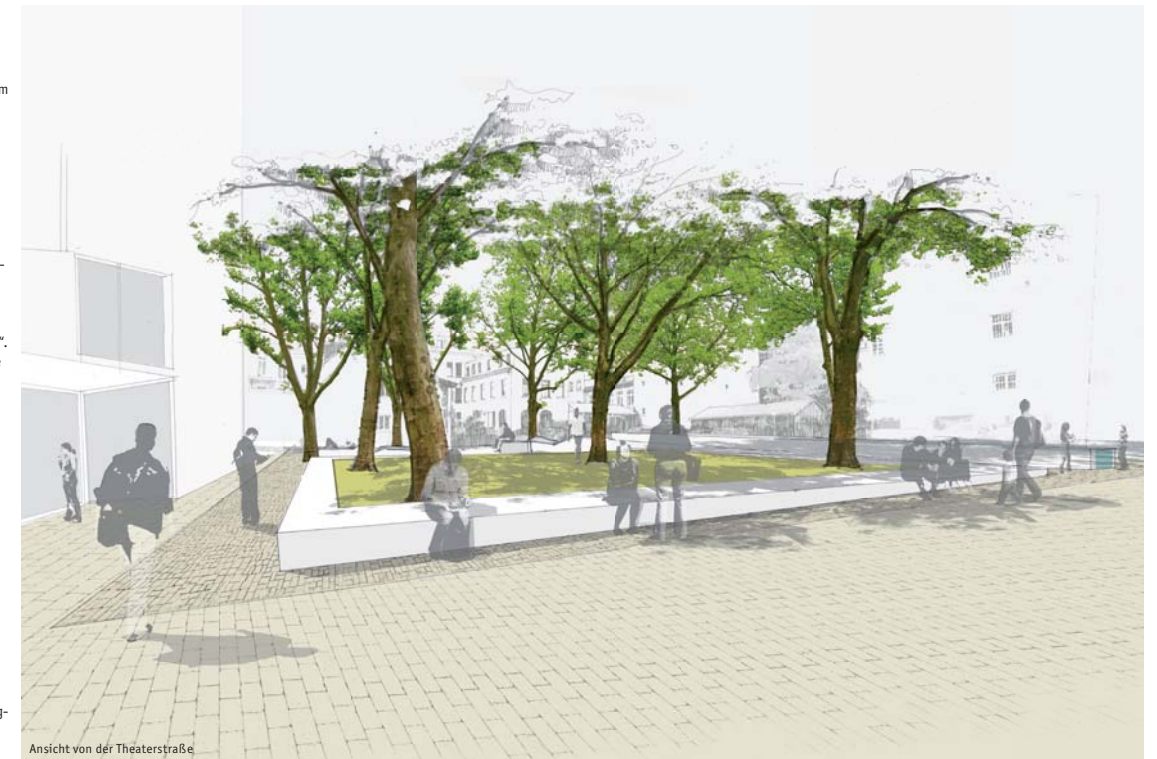
Ansicht von der Theaterstraße

Die Beläge der übrigen Flächen orientieren sich in ihrer Farblichkeit und Materialität am bereits vorhandenen warmgrauen Natursteinpflaster der Nebenflächen des Platzes. Die Fahrgassen sowie die Theaterstraße werden in gestocktem Großsteinreihenpflaster ausgebildet. Die Theaterstraße erhält eine mittige gepflasterte Entwässerungsrinne. Der Aufenthaltsbereich um die Bühne wird mit Kleinsteinpflaster im Passé-Verband belegt.