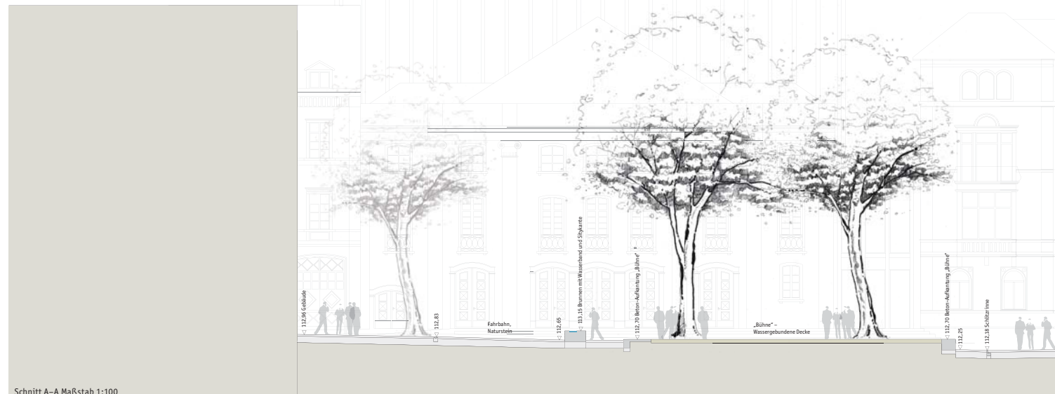
Schnitt A-A Maßstab 1:100

Die Beleuchtung soll den Theaterplatz nachts als ruhigen und stimmungsvollen Platz darstellen. Erreicht wird dies durch die Anstrahlung der großen Bäume und die dezente Beleuchtung der aufgehenden Ausstattungselemente wie der Bühne und der Sitzelemente. Trotz geringer Ausleuchtung wird der Platz so auch in der Tiefe erfassbar, so dass soziale Kontrolle möglich ist.