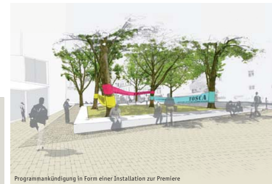
Programmankündigung in Form einer Installation zur Premiere