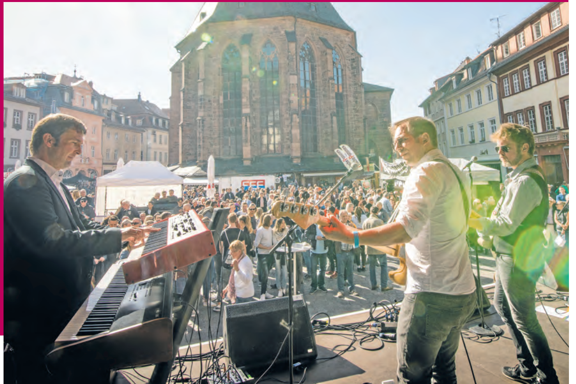
Wer tritt wann wo auf? Wo ist das nächste Angebot für Kinder? Wo ist die nächste Toilette? Zum ersten Mal gibt es zum Heidelberger Herbst einen Veranstaltungsguide in der MeinHeidelberg-App.

Großes Fest in der Altstadt am 30. September und 1. Oktober