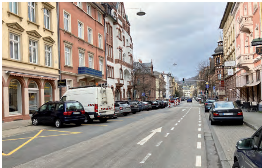
Bald fließt der Verkehr wieder: Die Erneuerung der Fernwärmeleitung in der Rohrbacher Straße steht kurz vor der Fertigstellung – drei Monate früher als geplant.